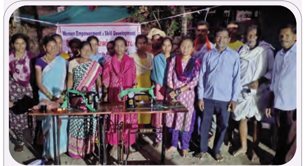
కుట్టు శిక్షణ కేంద్రాన్ని ప్రారంభిస్తున్న దృశ్యం